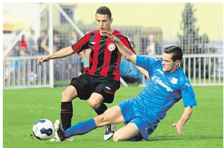
Skurz Chrudimští fotbalisté sehrají v neděli od 17 hodin v Čáslavi poslední utkání aktuálního ročníku ČFL.

Sto procentně mu budou na lavičce chybět Vácha a také disciplinárně potrestaný Adámek. (vot)